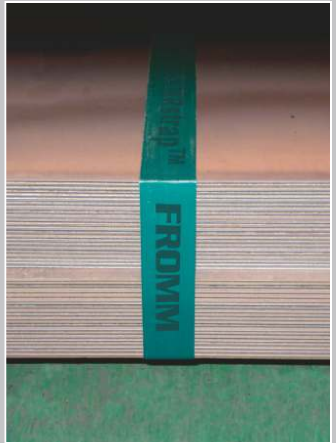
STARstrap™-plus - die neue Generation - oft kein Kantenschutz mehr nötig