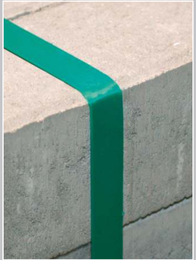
STARstrap™ - mit hoher Kantenfestigkeit